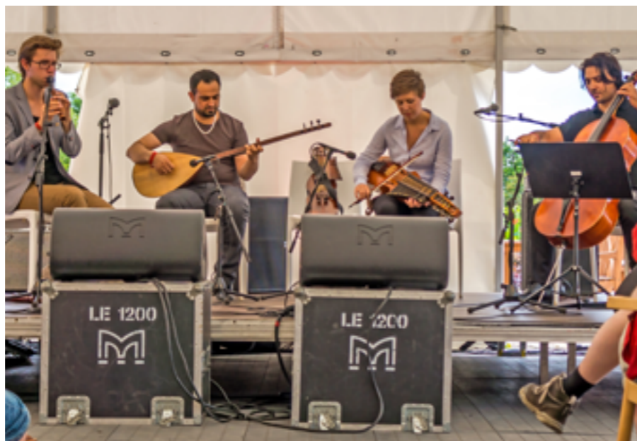
Telemanns Spelmän.

Den 9 augusti, Taube Spelen, som har sin egen administration.