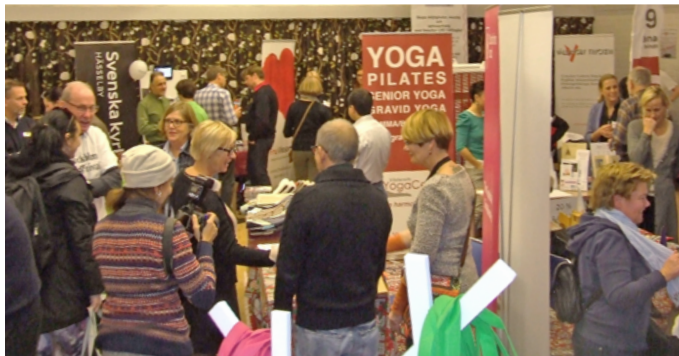
Företagsmässan 2014.

Snart är det dags för årets företagsmarknad! Företagsgruppen anordnar företagsmarknaden för tredje året i rad tillsammans med Västerorts Yoga & Rehab Center.