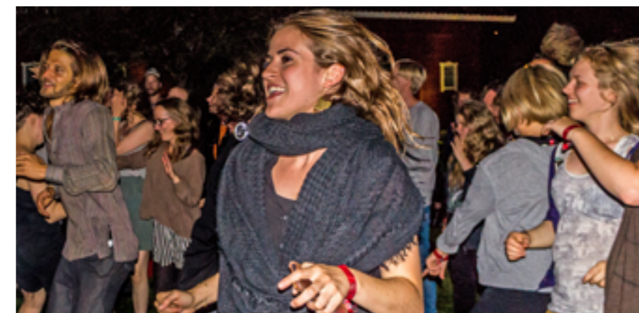
Publik som dansar.

Folkmusiker mot rasism, fanns på plats och ledde bl a årets allspel. Det uppmärksammades av den engelska tidningen The Guardian som hade en journalist på plats för att följa festivalens arbete och för att göra intervjuer med artister, festivalledning och Folkmusiker mot rasism. http://www.theguardian.com/world/2015/aug/09/sweden-folk-musicians-against-racism-fmr