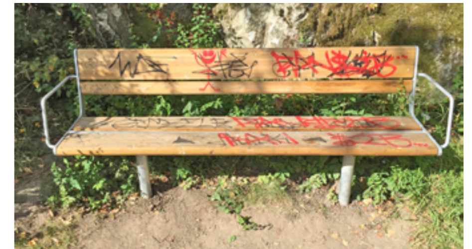
Nedklottrade bänkar inbjuder inte att vila på.