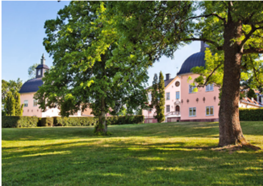
Hesselby slott.