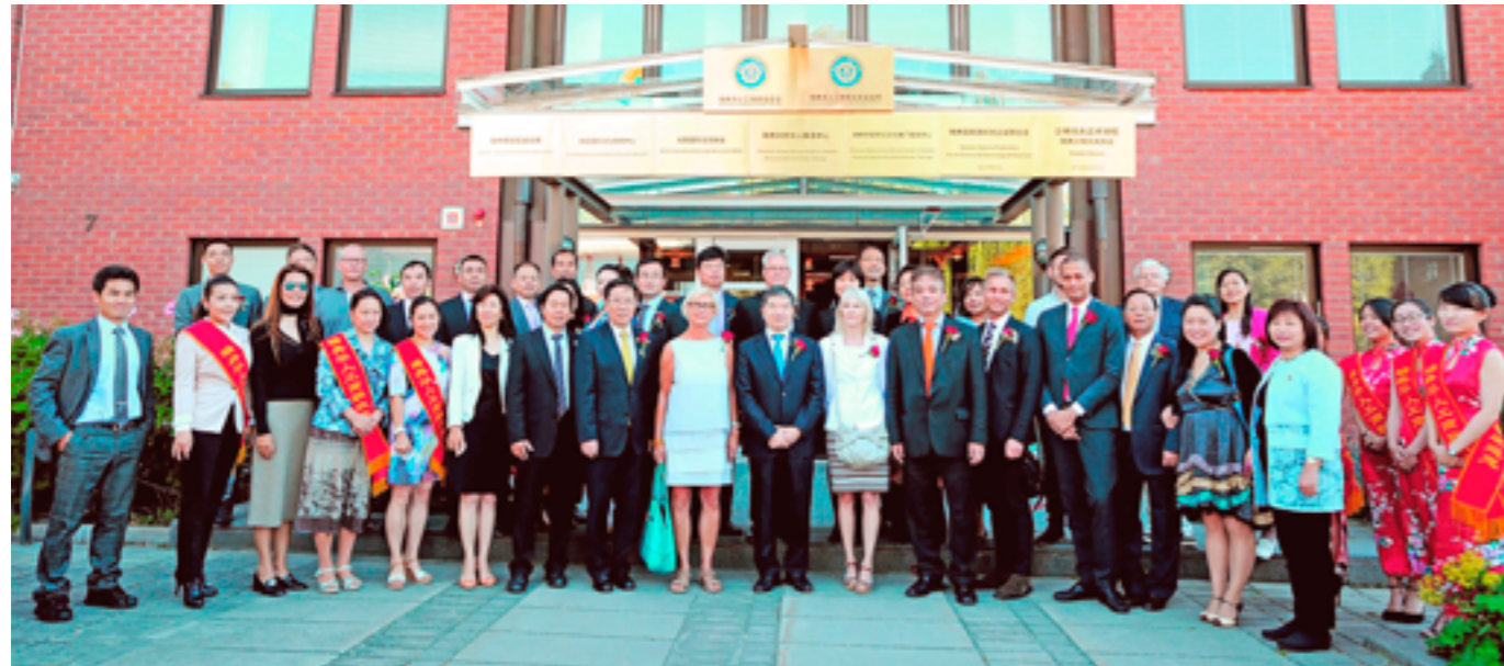
Kinesiska Företagarförbundet inviger sina nya lokaler i Vinsta.

Den 14 augusti invigde kinesiska Företagarförbundet i Sverige sina nya lokaler på Siktgatan 7 i Vinsta.