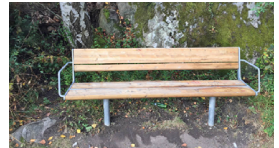
Efter saneringen blir de som nya.