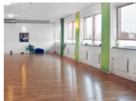
Mässlokalen, en av flera stora lokaler på Västerorts Yogacentrum där marknaden kommer att hållas den 25 november.