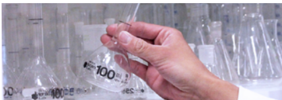
Laboratoriet är hjärtat i verksamheten.

skrivit boken Surface Coatings och blev inspirerad till att starta ett kunskapsföretag. Syftet med företaget var att hitta