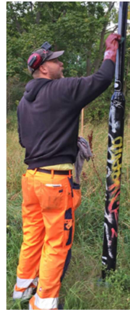
Klotterkonsulten griper in.